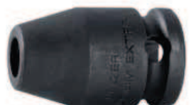
7407H / 7408H